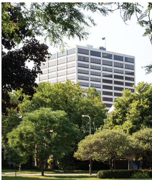
Sede mundial de Rotary International en Evanston, Illinois (EE.UU.)

Rotary International está administrada por su Secretaría, la cual está compuesta por más de 800 empleados. La sede mundial de Rotary International está ubicada en Evanston, Illinois (EE.UU.), en el edificio One Rotary Center. Este edificio cuenta con un auditorio con 190 asientos, los archivos de Rotary y una suite ejecutiva con salas de conferencia para la Directiva de RI y el Consejo de Fiduciarios de La Fundación Rotaria, así como las oficinas del presidente de RI y otros funcionarios sénior. También cuenta con una réplica de la Sala 711, lugar en que se realizó la primera reunión de Rotary.