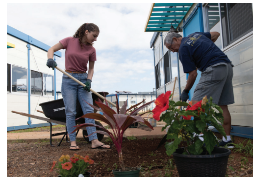
Los socios de Rotary y los miembros de la comunidad se unen para servir

Los Grupos de Rotary para Fomento de la Comunidad (GRFC) son grupos patrocinados por un club rotario e integrados por personas no afiliadas que desean ayudar a sus propias comunidades por medio de proyectos de servicio. Los rotarios brindan pericia profesional, orientación, aliento, estructura organizativa y algunos materiales de ayuda, mientras que los integrantes de los GRFC contribuyen con su labor y sus conocimientos sobre las necesidades de la comunidad. Este programa de servicio basado en la comunidad se creó en 1986 con el propósito de mejorar la calidad de vida en aldeas, vecindarios y otras comunidades.