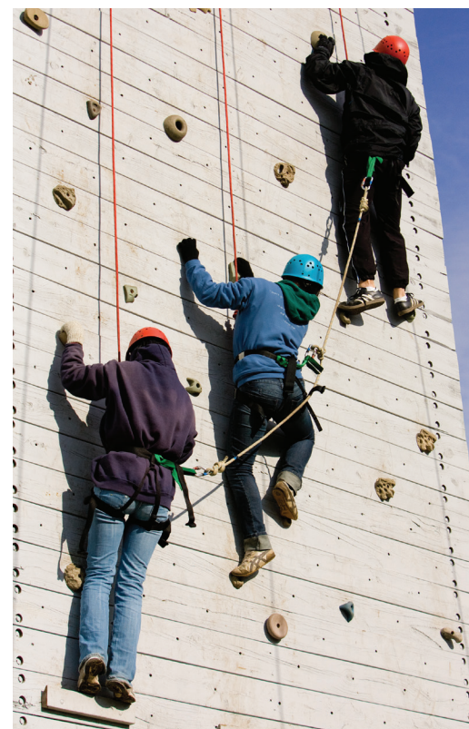
Los eventos de RYLA inculcan valores de servicio y liderazgo

Cada año, miles de jóvenes son seleccionados para asistir a campamentos o seminarios de liderazgo patrocinados por Rotary, por medio de los Seminarios de Rotary para Líderes Jóvenes (RYLA). Grupos de personas destacadas de 14 a 30 años de edad pasan varios días en una atmósfera informal, participando en un programa exigente de capacitación para el liderazgo, con discusiones guiadas, presentaciones motivadoras y actividades sociales diseñadas con el fin de promover el desarrollo personal, las habilidades para el liderazgo y el civismo. Cada programa o evento de RYLA se adapta a la edad de los participantes.