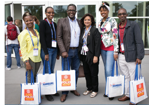
Asistentes a la Convención de Rotary Internacional de 2019.

La primera Convención de Rotary se realizó en Chicago, Illinois (EE.UU.) en agosto de 1910.