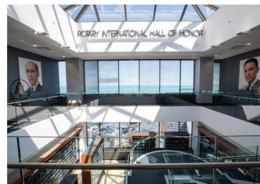
Galería de la Sociedad Arch Klumph en el piso 18 de la sede mundial de Rotary International

One Rotary Center recibe anualmente a más de 2000 socios e invitados. De lunes a viernes se ofrecen visitas guiadas gratuitas en diferentes idiomas. Solicita una visita guiada en rotary.org/tours .