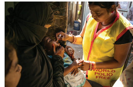
Una rotaria administra la vacuna contra la polio

Las contribuciones de nuestros socios y de otros colaboradores de la Fundación nos ayudan a llevar un cambio sostenible a comunidades necesitadas. Para averiguar cómo ayudar a nuestra Fundación, consulta al presidente del comité de La Fundación Rotaria de tu club o visita rotary.org/donate Si deseas más información, descarga la Guía de Consulta Rápida de La Fundación Rotaria o toma el curso Información básica sobre La Fundación Rotaria en el Centro de Formación de Rotary.