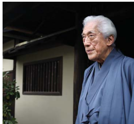
En frente al salón de té Urasenke, donde vive en Kioto. La revista Rotary publicó la extraordinaria historia de Sen en su número de agosto de 2022.