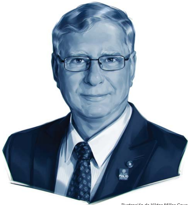
Ilustración de Viktor Miller Gausa